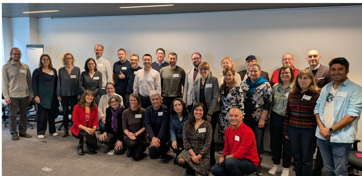
Figure 3. Picture of PanEuCOPT's initial management team

Our vision is clear: to create a functional and safe alternative to conventional antibiotic prescriptions, urgently needed in times of increasing antibiotic resistance. This initiative could pave the way for novel antimicrobial therapies, addressing not only scientific but also societal challenges. By definition, each COST Action is a “living” organization open for everyone to join and shape the future together (Fig. 3).