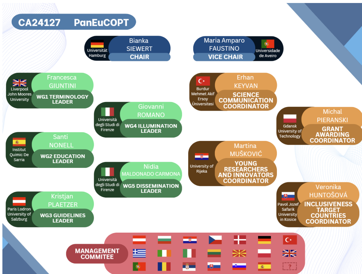
Figure 2. The organisational layout of PanEuCOPT.

Our vision is clear: to create a functional and safe alternative to conventional antibiotic prescriptions, urgently needed in times of increasing antibiotic resistance. This initiative could pave the way for novel antimicrobial therapies, addressing not only scientific but also societal challenges. By definition, each COST Action is a “living” organization open for everyone to join and shape the future together (Fig. 3).