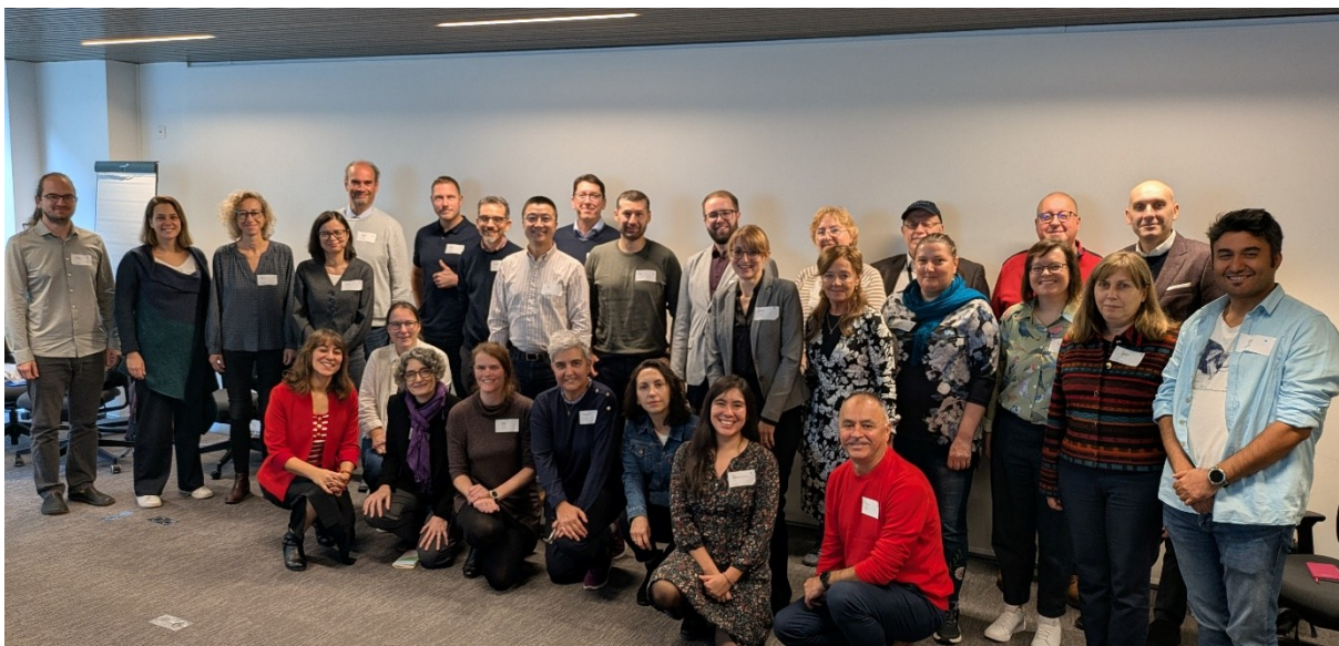
Abbildung 3: Das initiale Team von PanEUCOPT vom ersten Management Committee Meeting in Brüssel

Unsere Vision ist klar: Eine funktionale und sichere Alternative zur klassischen Antibiotikaverschreibung zu schaffen, die gerade in Zeiten wachsender Antibiotikaresistenzen dringend benötigt wird. Diese Initiative wird den Weg für neuartige antimikrobielle Therapien ebnen und damit nicht nur wissenschaftliche, sondern auch gesellschaftliche Herausforderungen adressieren. Jede COST Action ist per Definition eine lebende Organisation, für die sich jeder -auch Sie- bewerben kann, um aktiv und gemeinsam die Zukunft mit uns (Abbildung 3) zu gestalten.